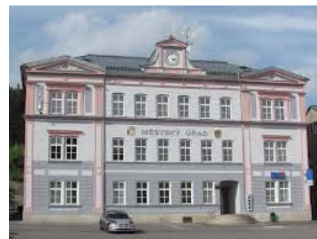
Sídlem centra je Městský úřad Smržovka

Starostové obcí z území Mikroregionu Tanvaldska v rámci podpory dobré meziobecní spolupráce uvítali možnost této strukturované pomoci, a to především v oblastech právní podpory a také v oblasti rozvojových záměrů