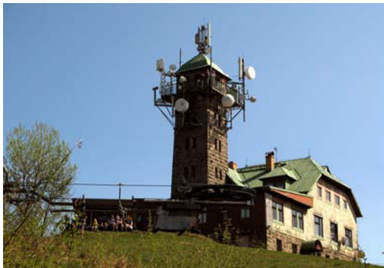
Mezi oblíbené výletní cíle na Tanvaldsku patří rozhledny

Mikroregion Tanvaldsko je seskupení dvanácti obcí v okolí města Tanvaldu, ležících na úpatí Jizerských hor. Většina obcí se nachází v nadmořské výšce nad 500 m n. m. Svazek obcí vznikl v roce 2000 a jeho cílem je ochrana a prosazování společných zájmů a spolupráce na všestranném rozvoji regionu.