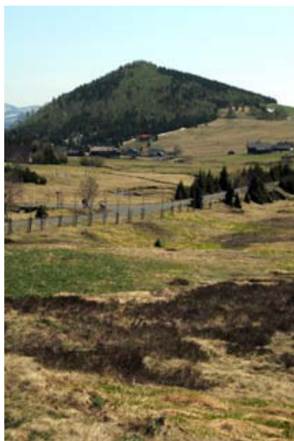
Osada Jizerka je východiskem mnoha značených tras pro pěší, cyklisty i lyžaře